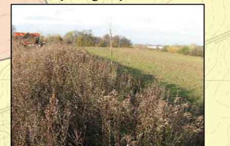
Fot. 3. Teren upraw rolnych na wysoczyźnie przeznaczony pod zabudowę usługowo-mieszaniową.

Olštyn; 2011r. Opracowa 1 : Zbigniew Zaprzęski Opracowanie komputerowe i graficzne: Krzysztof Krupifski ZMIANY: - granica projektowanego obszaru ochronnego GZWP 214 - Tereny zieleni na obrzeżach miasta niezainwestowane lub zainwestowane ekstensywnie przeznaczone do zainwestowania lub do intensyfikacji zainwestowania w projekcie zmiany planu zagospodarowania przestrzennego miasta. - Zaktualizowane obszary zagrożenia powodziowego 1% (raz na sto lat), opracowane w oparciu o Prawo Wodne i zatwierdzone przez ministra właściwego d/s gospodarki wodnej