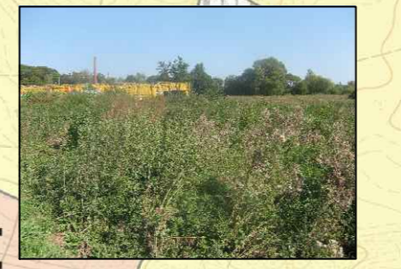
Fot. 2. Teren nieużytków bagiennych, częściowo już przekształconych (gruzowisko), przeznaczony pod zabudowę usługową.