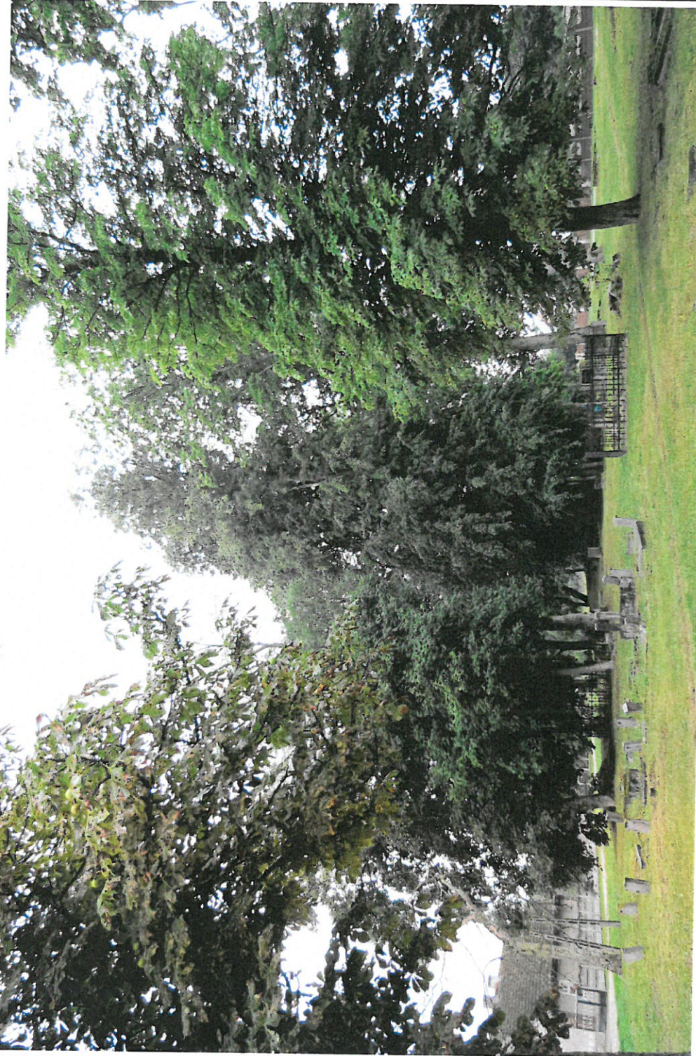
Widok ogólny cmentarza z NE na SW

8. Fotografia z opisem wskazującym orientację: