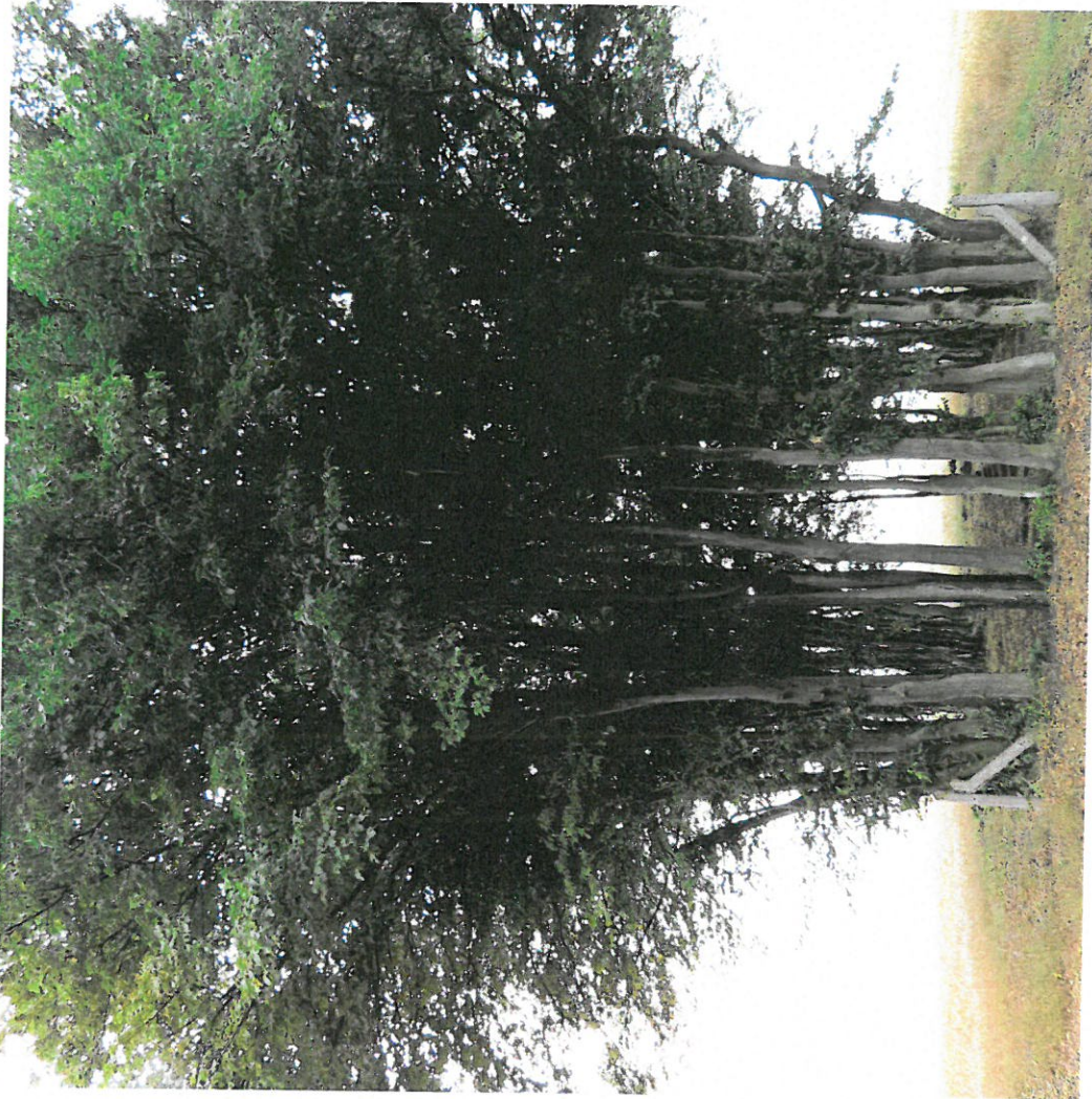
Widok ogólny cmentarza z N na S

8. Fotografia z opisem wskazującym orientację: