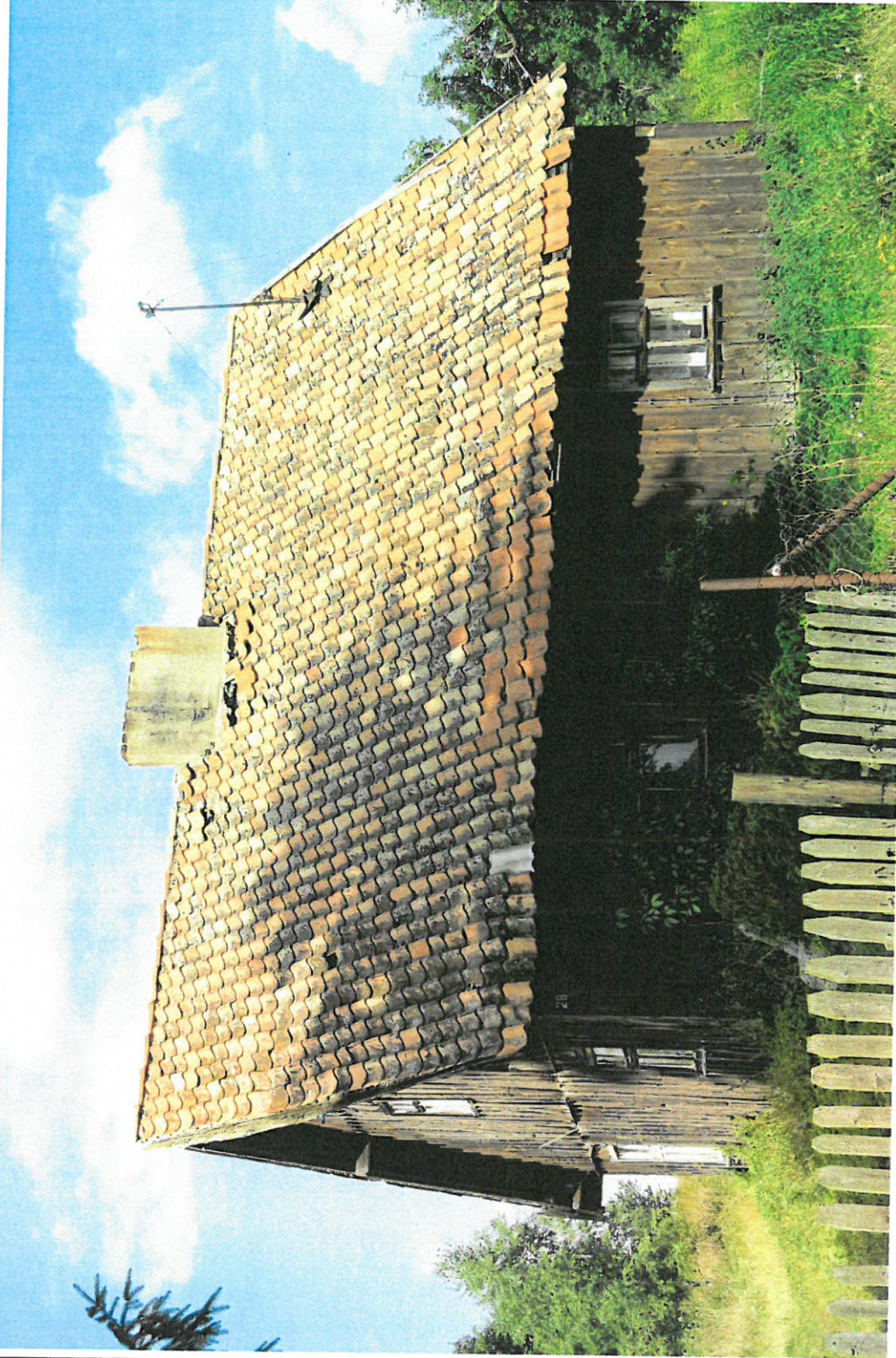
Widok ściany frontowej i szczytowej z E na W

8. Fotografia z opisem wskazującym orientację: