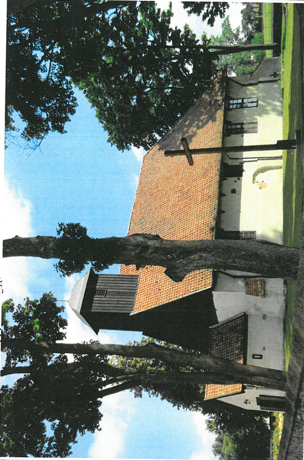
Widok ściany wzdłużnej i frontowej z SW na NE

8. Fotografia z opisem wskazującym orientację: