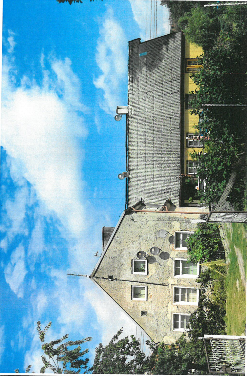
Widok ściany frontowej i szczytowej z S na N

8. Fotografia z opisem wskazującym orientację: