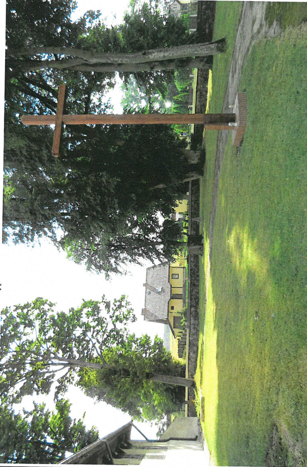
Widok ogólny terenu cmentarza z E na W

8. Fotografia z opisem wskazującym orientację: