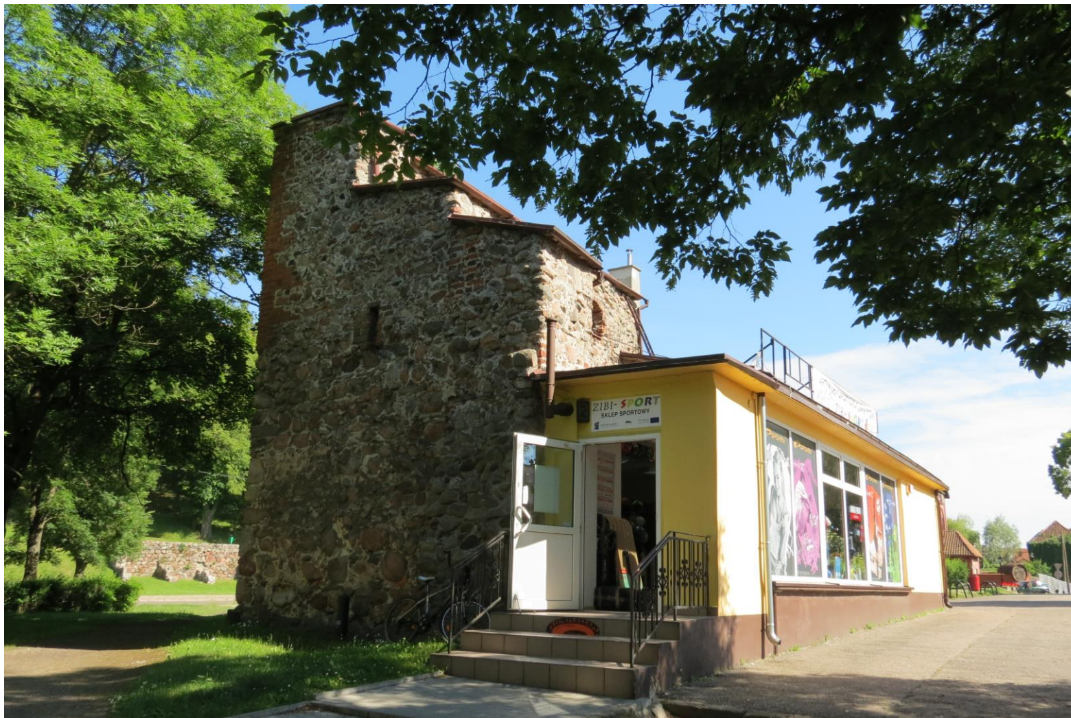
Widok bryły obiektu z NW na SE

8. Fotografia z opisem wskazującym orientację: