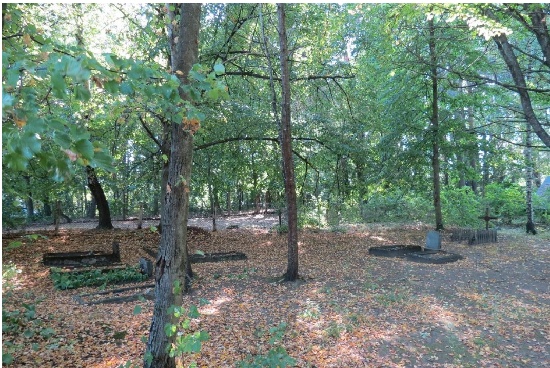
Cmentarz ewangelicki w Nataci Małej