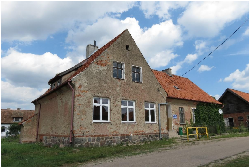
Budynek szkoły wiejskiej w Bartoszkach