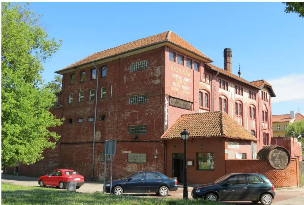
Browar w Nidzicy