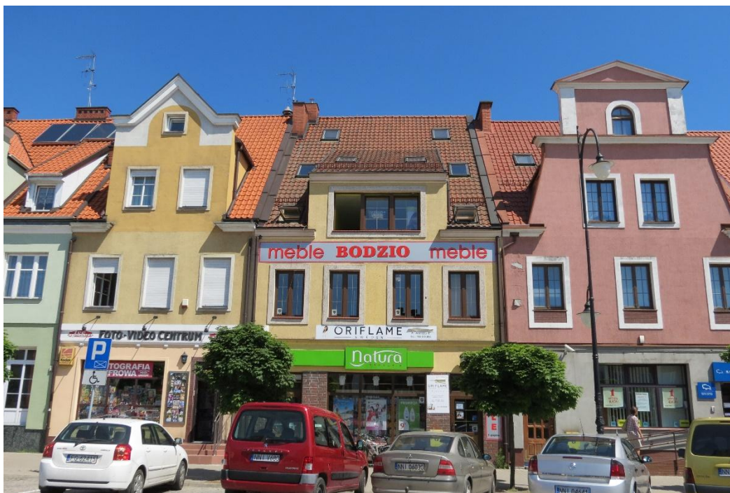
Kamienice przy Placu Wolności w Nidzicy