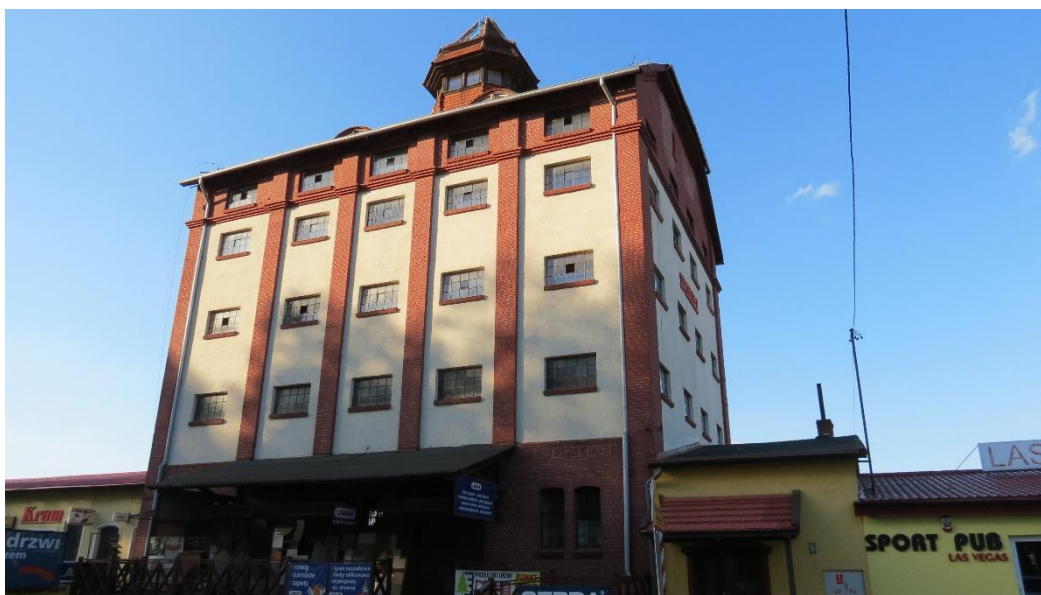
Dawny spichlerz przy ul. Olsztyńskiej w Nidzicy