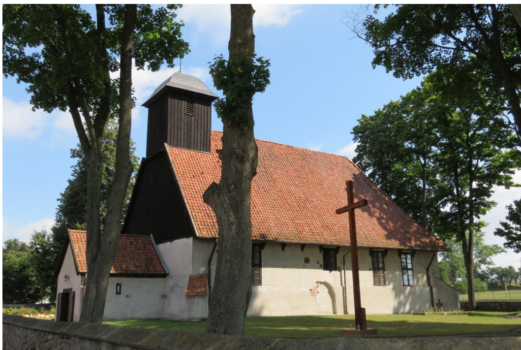
Kościół w Kanigowie