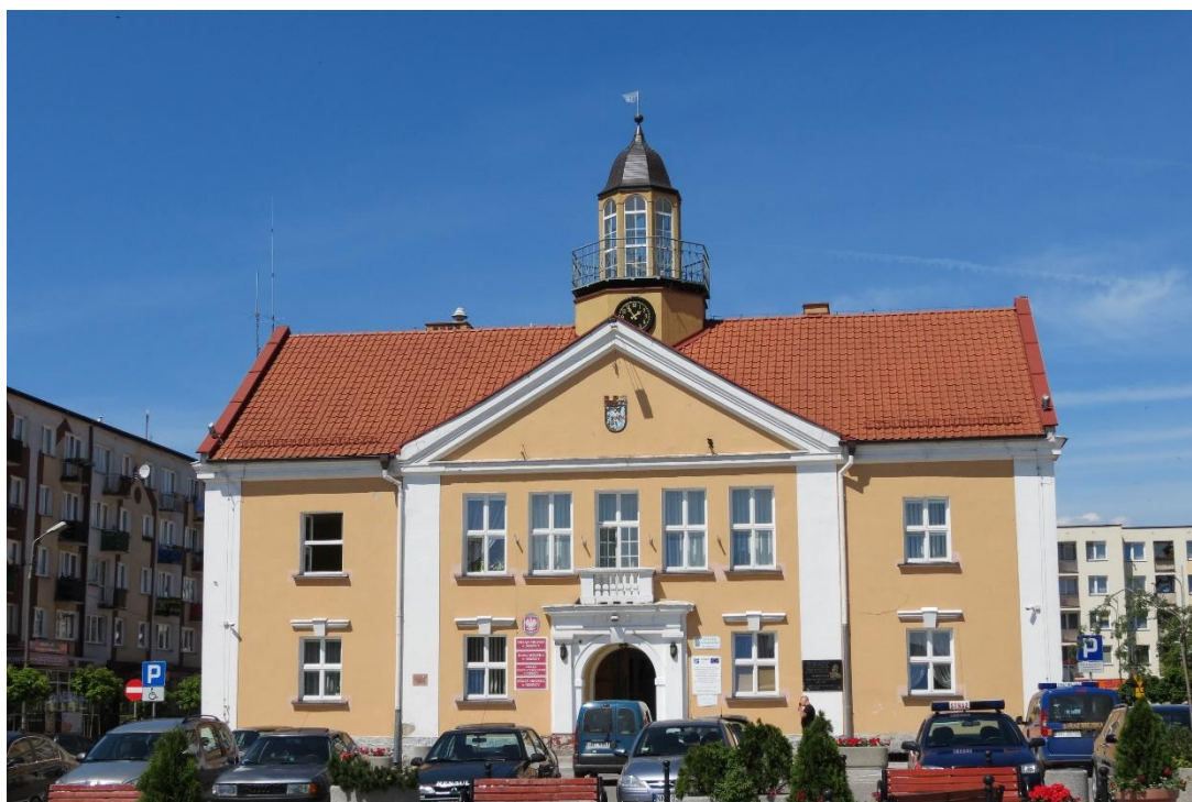
Ratusz w Nidzicy

Na terenach wiejskich największą grupę budowli użyteczności publicznej stanowią szkoły wznoszone od drugiej połowy XIX w. Były to zespoły zabudowań składające się z budynku głównego z pomieszczeniami klasowymi oraz mieszkaniami nauczycieli oraz zabudowy gospodarczej wykorzystywanej przez nauczycieli. Są to budynki w większości jednokondygnacyjne, czasem na podmurówce, z gankami, wyróżniające się detalami architektonicznymi na tle typowej zabudowy mieszkaniowej. Charakteryzuje je szczególnie lokalizacja – w centralnej części wsi.