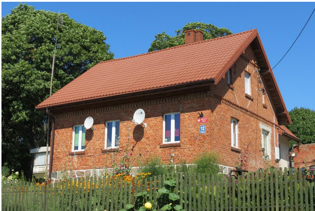
Murowany dom z końca XIX – początku XX w. we wsi Bolejny