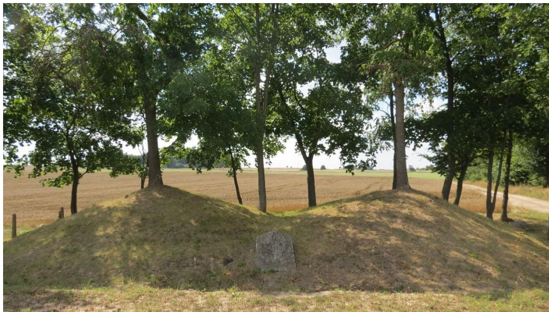
Jeden z czterech cmentarzy z czasów I wojny światowej na gruntach wsi Frąknowo