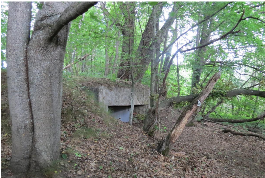
Schron z 1939 r. pod wsią Bolejny