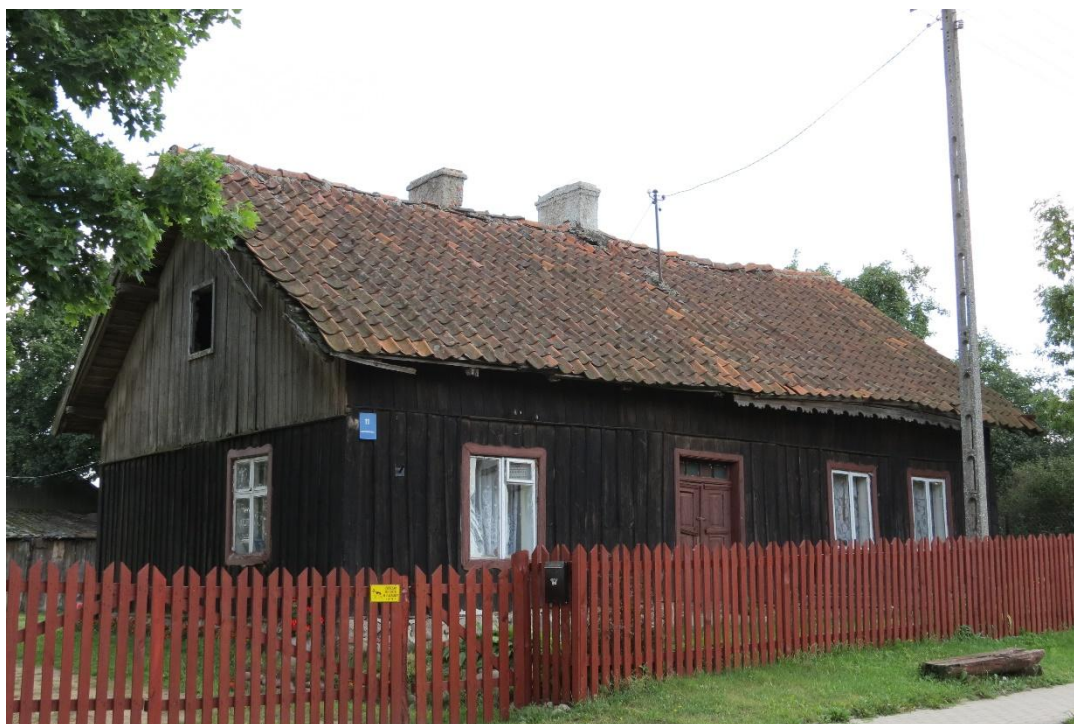
Drewniany dom z końca XIX w. we wsi Grzegórzki

domy w większości drewniane, które w XIX wieku zostały na tym terenie częściowo zastąpione budynkami murowanymi z czerwonej cegły, a niekiedy tynkowane. Wznoszone na planie prostokąta, w większości jednokondygnacyjne, nakryte dachem dwuspadowym (ceramicznym), ustawione zarówno kalenicowo jak i szczytowo do drogi. Dla większości domów typowe są kolorowe opaski okienne i drzwiowe. Spotkać można również domy okazalsze, dwukondygnacyjne, na podmurówce, z wystawkami w partii dachowej z osobnym daszkiem dwuspadowym, z gankami, czasem kryte dachem naczółkowym. Budynki gospodarcze były w większości drewniane, obecnie murowano – drewniane, pojedynczo można spotkać szachulcowe.