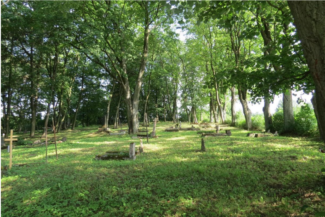
Wnętrze cmentarza ewangelickiego przy ul. Limanowskiego w Nidzicy