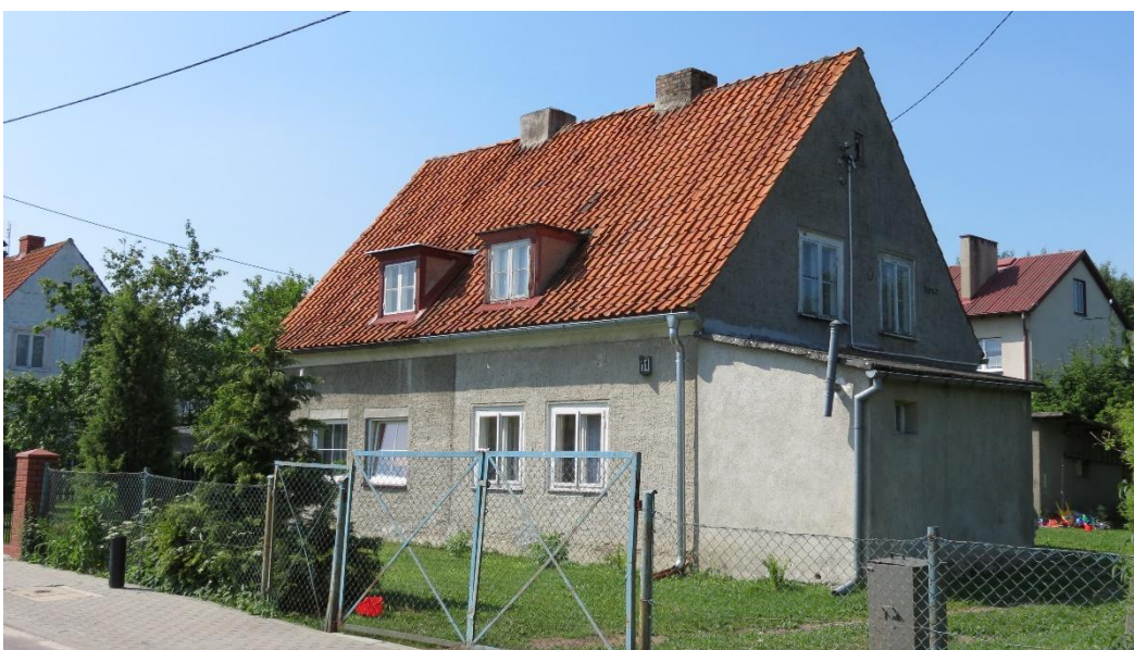
Dom socjalny z drugiej połowy lat 20 – pierwszej połowy lat 30. XX w. przy ul. Robotniczej w Nidzicy

Zabudowa wiejska w województwa warmińsko-mazurskim jest drewniana i murowana. Już na początku XX w. typowym elementem wiejskiej zabudowy stał się murowany budynek mieszkalny, z murowanymi lub drewniano-murowanymi zabudowaniami gospodarczymi. W przypadku zabudowy drewnianej najbardziej powszechna była konstrukcja zrębowa. Budynki murowane można podzielić na dwa ogólne typy: budynki tynkowane oraz budynki wznoszone z czerwonej, licowej cegły. Te ostatnie stały się charakterystycznym elementem pejzażu Warmii i Mazur. Zasadnicze wypełnienie przestrzeni wsi stanowiła zabudowa mieszkaniowa i gospodarcza. Typowy układ to zagroda z domem mieszkalnym od frontu i zabudowania gospodarcze w obrębie podwórka. Tradycyjne budownictwo to