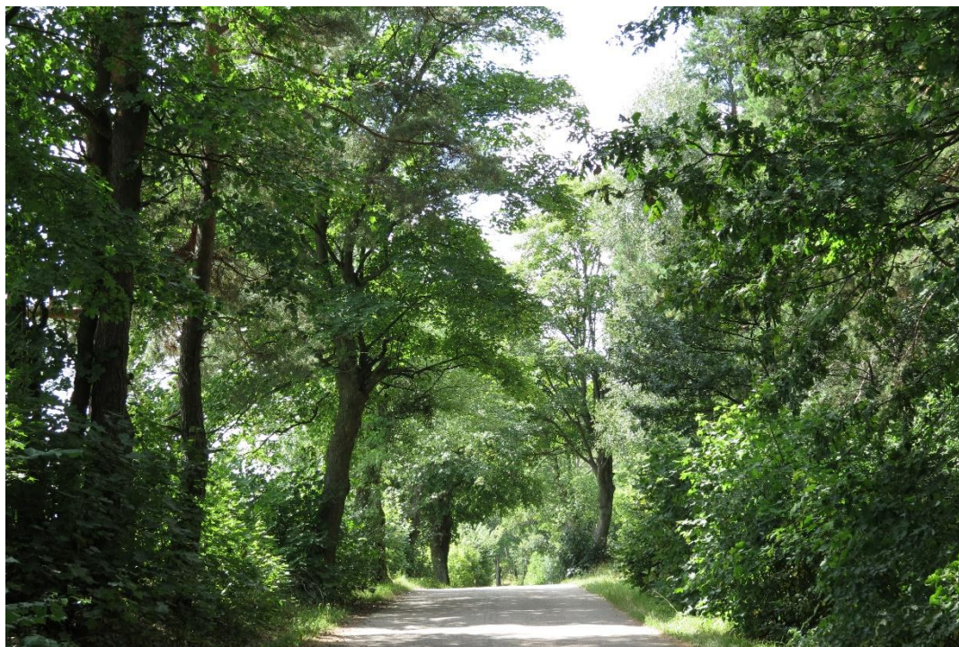
Zabytkowa aleja przydrożna wzdłuż drogi Bartoszkki-Nidzica

lokalnym. Towarzyszyły również drogom łączącym majątki z folwarkami. Zwykle aleje dochodziły do granicy wsi. W zadrzewieniach alejowych stosowano gatunki drzew długowiecznych, dobrze znoszących tutejsze warunki klimatyczne, m.in. dąb, jesion, lipa, grab, klon, brzoza.