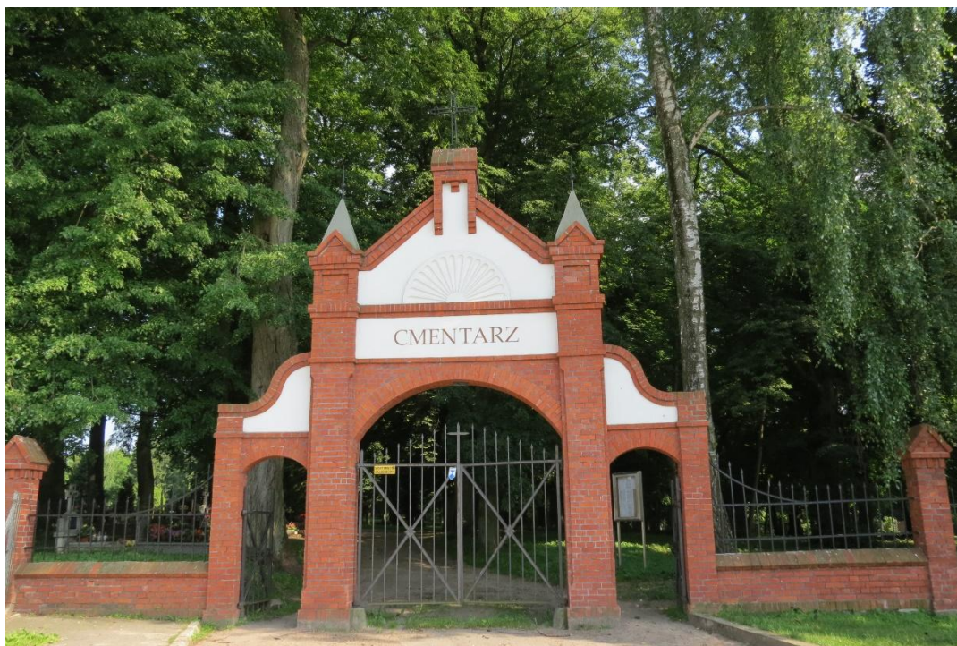
Brama cmentarza przy ul. Warszawskiej w Nidzicy

Na terenie gminy Nidzica znajdujemy cmentarze ewangelickie, w przewadze współcześnie nieczynne, mniej liczne cmentarze katolickie oraz cmentarze wojenne, najliczniejsze z czasów I wojny światowej. Stan zachowania zabytkowych cmentarzy cywilnych na terenie gminy nie należy do najlepszych. Wynika to przede wszystkim z zapomnienia i aktów wandalizmu które miały miejsce w przeszłości, najintensywniej w okresie tuż po II wojnie światowej.